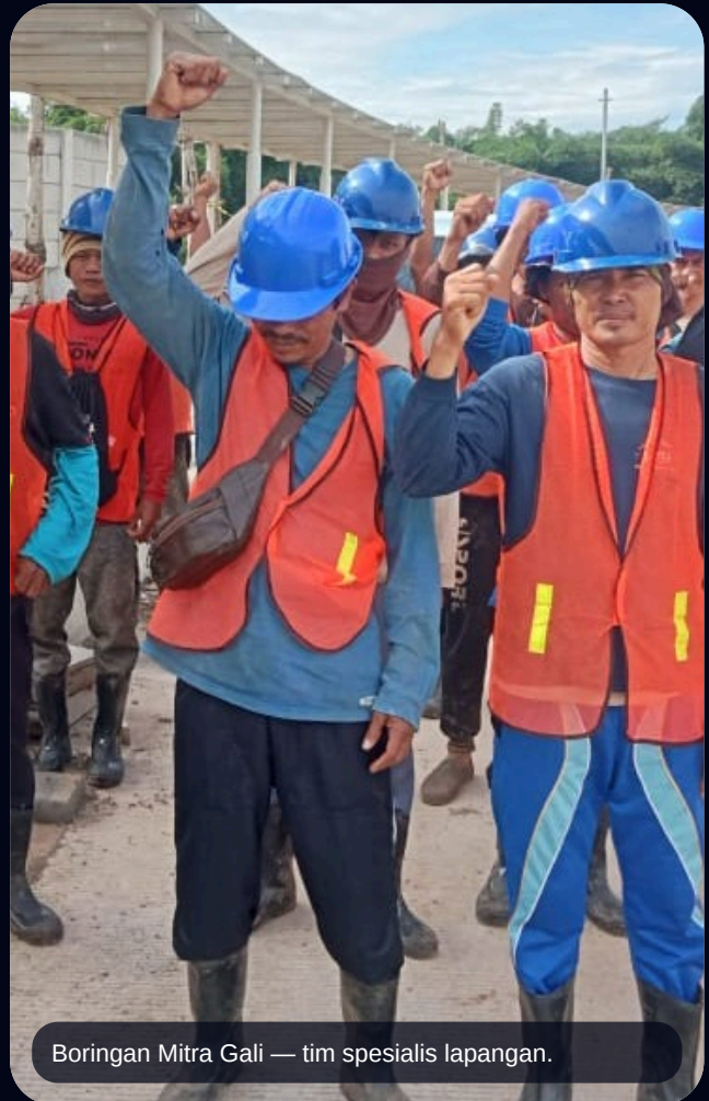
Boringan Mitra Gali — tim spesialis lapangan.

Layanan: galian kabel, boring horizontal, rojok manual, jalur utilitas bawah tanah.